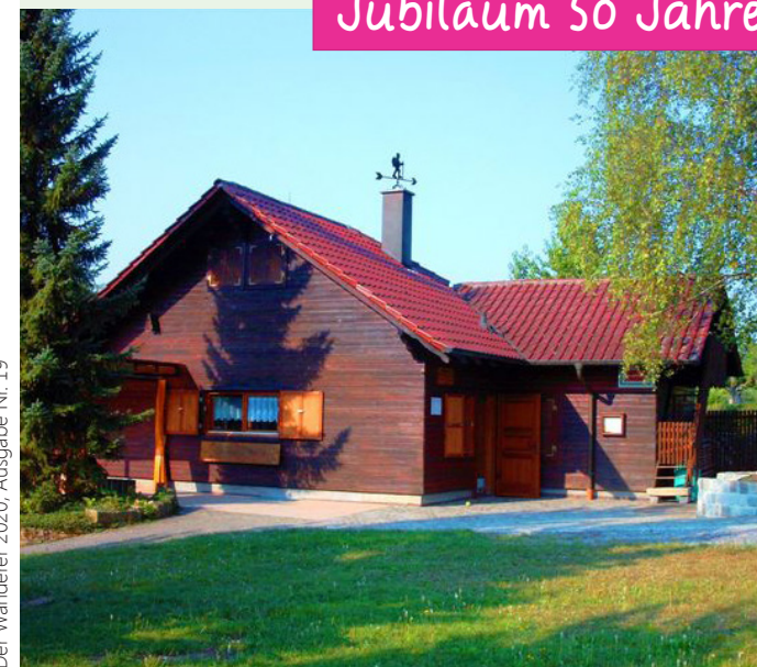
Der Wanderer 2020, Ausgabe Nr. 19